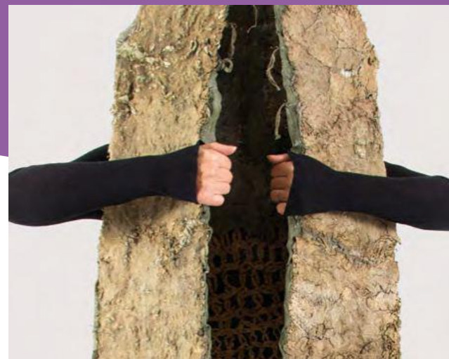
Visuel: Exposition "Bodyguard", Aline Ribière – Photo: Karl Harancot